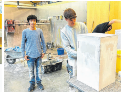
Die PTS-Schüler erlebten, wie praxisnah der Unterricht an der Berufsschule ist.